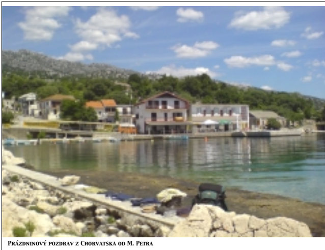
PRÁZDNINOVÝ POZDRAV Z CHORVATSKA OD M. PETRA