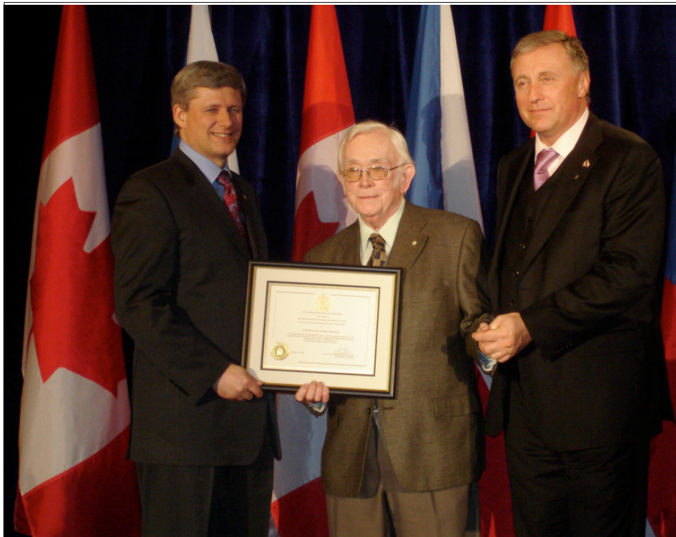
KANADSKÝ MINISTERSKÝ PŘEDSEDA ST. HARPER, JOSEF ŠKVORECKÝ A ČESKÝ PREMIÉR M. TOPOLÁNEK V HALE KOSTELA SV. VÁCLAVA

Nabitý událostmi byl následující pátek. Nejprve v odpoledních hodinách byla zahájena výstava Zmizelí sousedi v Miles Nadal Jewish Community Centre. Důležité je, že panely nepřipravili profesionální výtvarníci, ale studenti středních škol, kteří si položili otázku, kam se poděli lidé, kteří žili v jejich městě. Výstava se však nesoustřeďuje na místa, která jsou notoricky známá jako Pražský židovský hřbitov, Olšanské hřbitovy, ale jsou zde místa, která jsou neznámá, o jejichž židovských komunitách se téměř