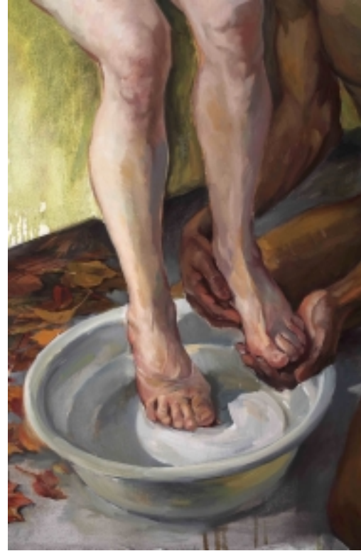
Čekání na zázrak - detail