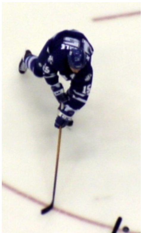
TOMÁŠ KABERLE V UTKÁNÍ S BUFFALEM

TK: Myslím si, že to byl podobný zápas jako včera, jenže včera jsme si to sami pokazili v třetí třetině, ale dnes jsme už zasluženě vyhráli. Škoda prvního utkání, mohli jsme mít za víkend čtyři body. Jsme rádi, že máme alespoň dva. Pořád jsme na dosah osmičky. Asi se rozhodne mezi mužstvy, s kterými hrajeme. Budeme muset z těch sedmi zápasů vyhrát alespoň pět nebo šest. Vypadá to, že to takhle bude až do konce. Bude to zajímavý konec sezóny.