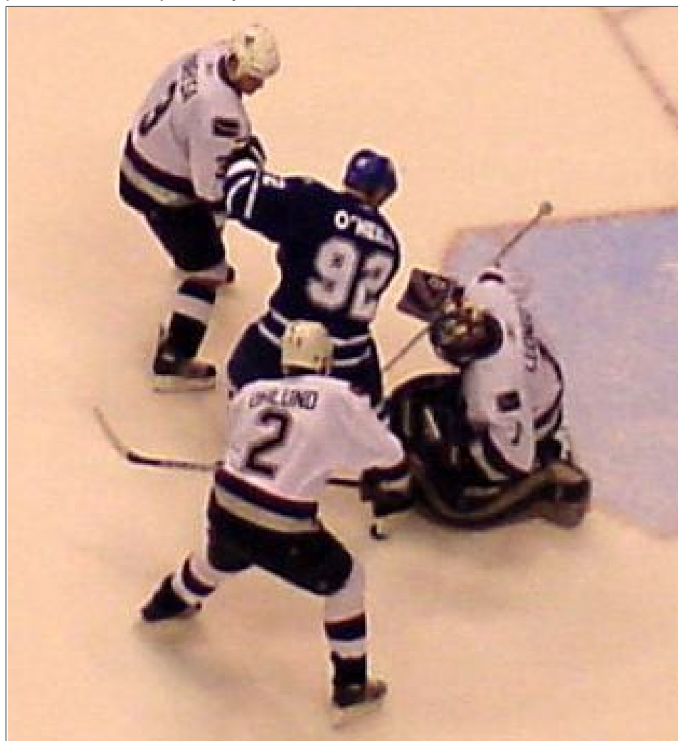
I S TOUTO AKCÍ O'NEILLA SI DOKÁZAL VÝBORNÝ VANCOUVERSKÝ BRANKÁŘ LUONGO PORADIT.

Vůbec největší návštěva v Air Canada Centre v letošním roce viděla neuvěřitelnou převahu Maple Leafs a zároveň jejich neskutečnou nemohoucnost. I o jediné jejich brance Toronta musel rozhodnout video-záznam, zatímco puk do torontské branky se sypaly jako mák z makovice. Již jen poměr střel na branku v první třetině 14:3 pro domácí Maple Leafs vypovídá o jejich převaze, ale výborný Luongo zlikvidoval až na jednu střelu vše. Na druhé straně se Raycroftovi vůbec nedařilo. V úvodu druhé třetiny Daniel Sedin dostal Vancouver do vedení, ale o utkání stále nebylo rozhodnuto. Rozhodující okamžik přišel v 43:46 minutě, kdy šel na trestnou lavici za hákování Tomáš Kaberle a jeho doprovodil na trestnou lavici Battaglia za nesportovní chování. Přesilovku využili Canucks stoprocentně, během 13 vteřin dvakrát skorovali a ujali se vedení 4:1. Když Salo po chybě Raycrofta vstřílel pátou branku bylo rozhodnuto a Naslund pak dokončil švédské řádění v Torontu. Výsledek 6:1 neodpovídá poměru sil na ledě, ale skutečnost, že Canucks využili pěti přesilovek z desíti je také výmluvná.