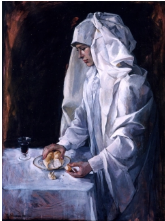
Oblečená v bílém