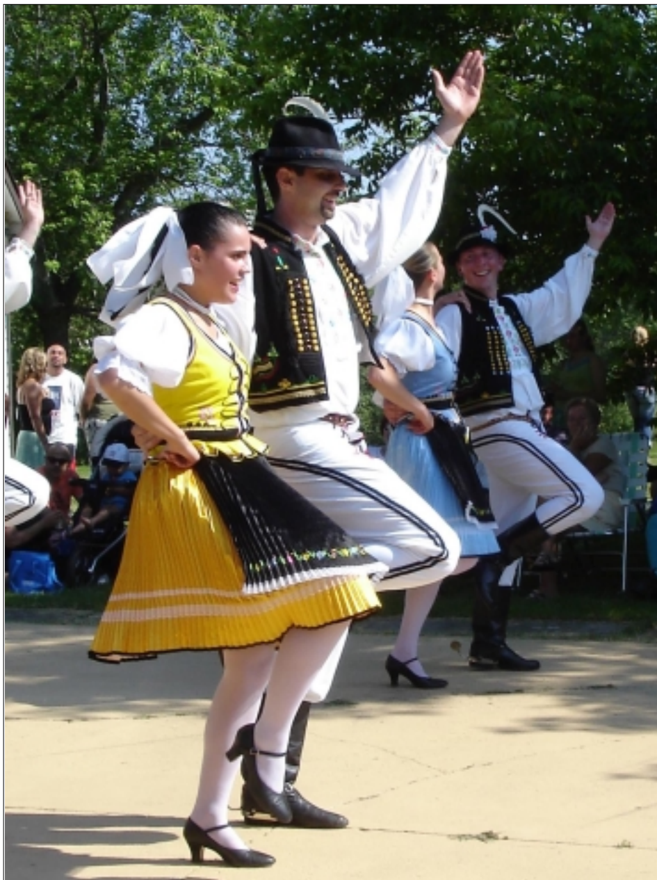
POSLEDNÍ SOBOTU V ČERVNU SE KONAL LETOŠNÍ ČESKÝ A SLOVENSKÝ DEN. NÁVŠTĚVNÍCI MĚLI MIMO JINÉ MOŽNOST VIDĚT VYSTOUPENÍ SOKOLŮ A SLOVENSKÉHO SOUBORU VÝCHODNÁ (NA SNÍMKU).