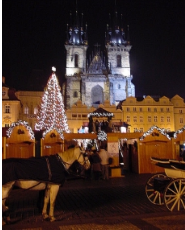
ADVENT PŘÍŠEL I NA STAROMĚSTSKÉ NÁMĚSTÍ