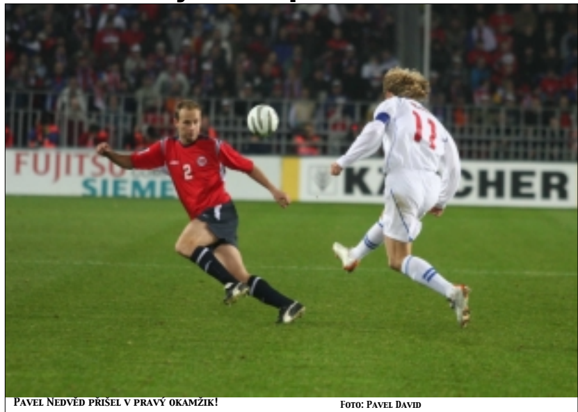
PAVEL NEDVĚD PŘIŠEL V PRAVÝ OKAMŽÍK!