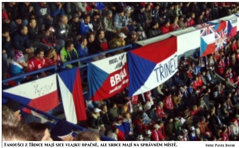
FANOUŠCI Z TŘINCE MAJÍ SICE VLAJKU OPAČNĚ, ALE SRDCE MAJÍ NA SPRÁVNÉM MÍSTĚ.

Byla přede mnou dlouhá neděle. Za jeden den jsem