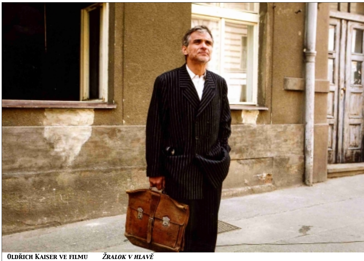
OLDŘICH KAISER VE FILMU ŽRALOK V HLAVĚ