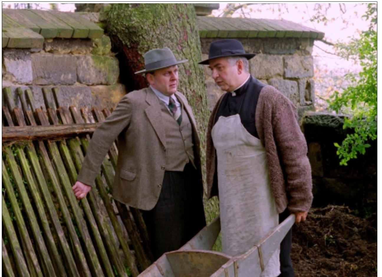
Jaroslav Dušek (vlevo) a Miroslav Donutil ve filmu Želary .

Stručná biografie: Jaroslav Dušek se narodil ve znamení Býka (on říká Vola) 30. 4. 1961 v Praze. V dětství byl ovlivněn siločarami divadla Semafor, kde pracovali oba jeho rodiče, následně založil vlastní divadlo (Vizita). Do roku 1989 učil Jaroslav Dušek autorské herectví na někdejší lidové konzervatoři, do roku 2000 pak na Konzervatoři Jaroslava Ježka autorskou výchovu a jevištní improvizaci. Dále nárazově učil na DAMU, JAMU, VOŠH, ZVOŠU a dnes učí na FAMU. Se svými studenty založil Divadelní Studio Čisté Radosti , pro které napsal hry Imaginární překvapení , Starostovic Mařenka a režíroval Romea a Julii od Williama Shakespeara. K jeho životním filmovým rolím patří učitel Saša Mašlař v Pelíškách a