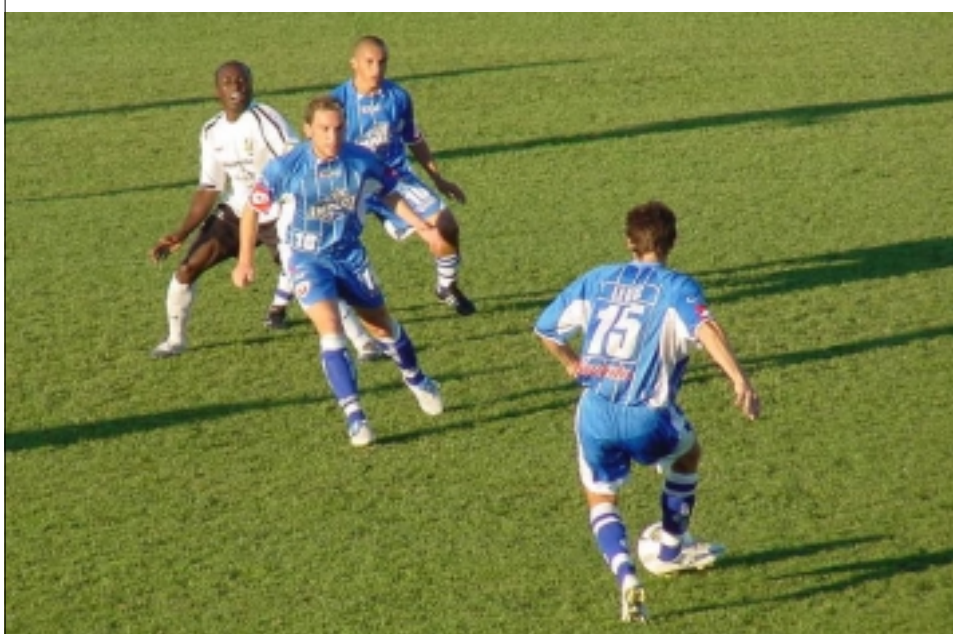
Lynx se v letošním ročníku USL příliš nedaří. Zatímco Montreal je na čele, Toronto je poslední. Přesto zápas s Montrealem byl zcela vyrovnaný a mnoho nechybělo a domácí získali aspoň jeden bod.