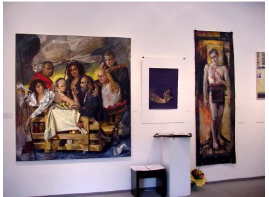
Z nedávné výstavy v Praze