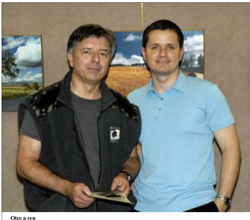
Otec a syn