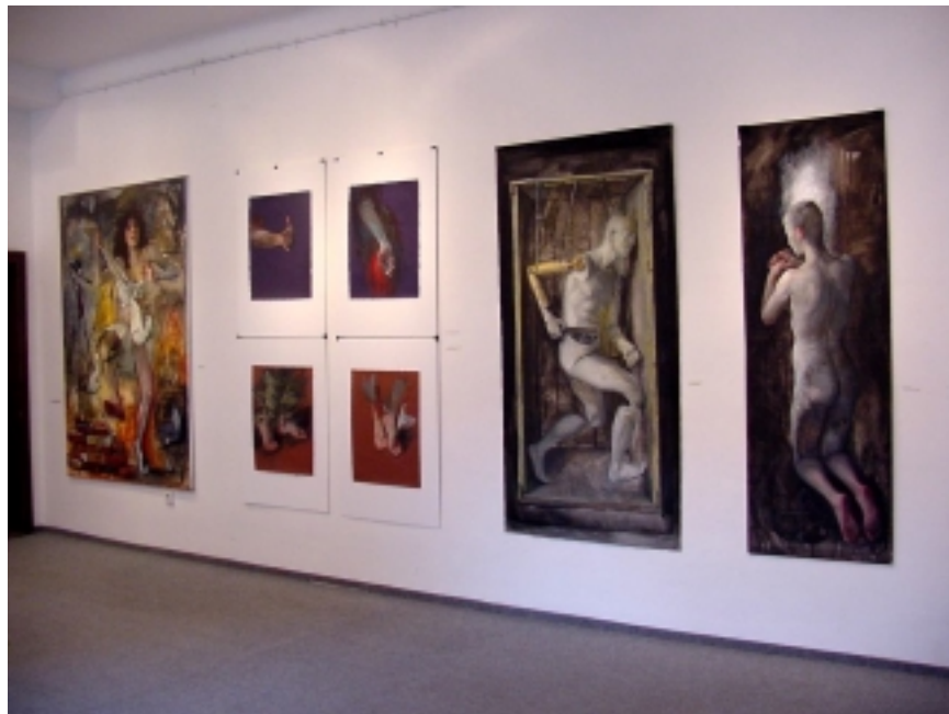
Z nedávné výstavy v Praze