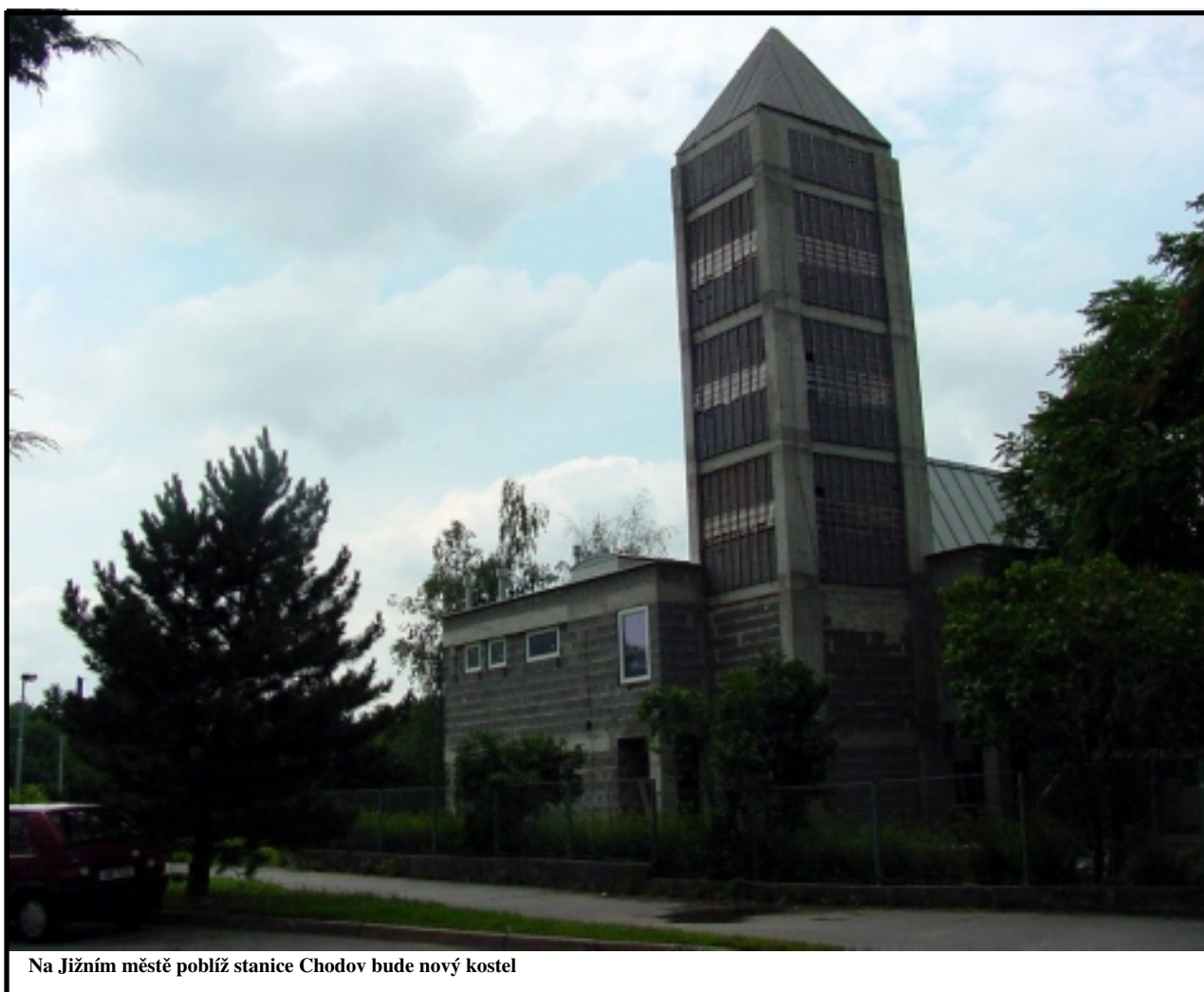
Na Jižním městě poblíž stanice Chodov bude nový kostel