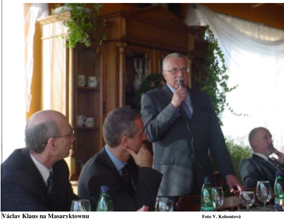
Václav Klaus na Masaryktownu