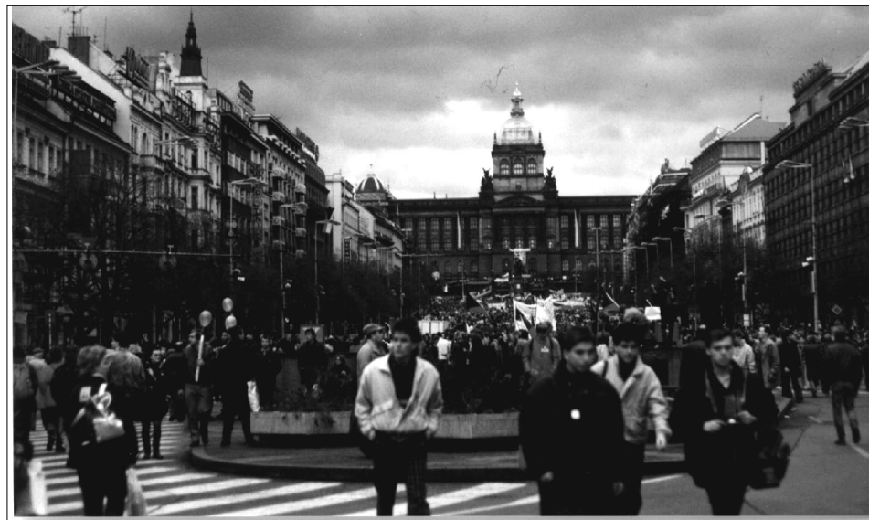
Historické fotografie z roku 1989 pořídila M. Gabánková