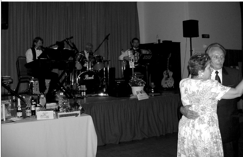
Alespoň fotografií se vracíme k svatováclavskému posvícení, při kterém hrála skupina M. Letka.