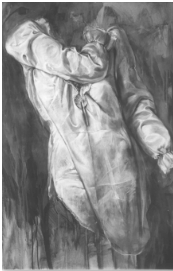
Zjevení - Revelo acrylic & oil sticks 8'x3'