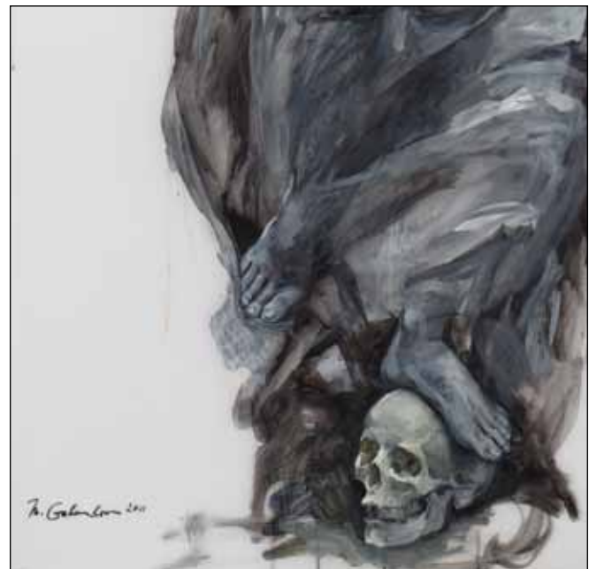
Vítězství nad smrtí (detail)