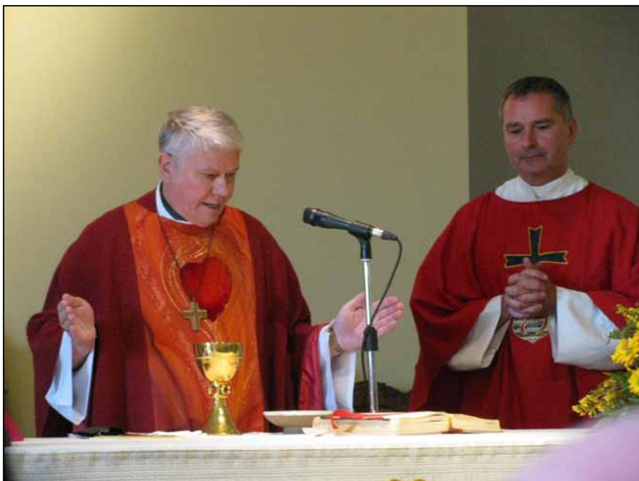
Biskup Václav Malý a farář Libor Švorčík při slavnostních bohoslužbách u sv. Václava

VM: Je pravdou, že Češi pijí pivo, ale Bavoráci nebo Dánové ho pijí ještě víc. Patříme tedy ke špičce, ale na špičce nejsme. Otázka ateismu je poměrně komplikovaná. Při posledních statistikách se méně lidí přihlásilo ke členství v křesťanských církvích včetně katolické. Důležité jsou však i důvody. V dotazníku je kolonka: Jakého jste vyznání, ale není povinnost tuto kolonku vyplňovat. Hodně lidí se rozhodlo tuto kolonku nevyplnit, přestože jsou to třeba i aktivní či pasivní členové církve. Dá se říci, že jedna pětina obyvatelstva se hlásí ke křesťanství, ale