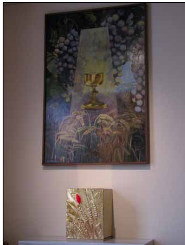
Nový obraz v kostele sv. Václava od M. Kirové

Tohle bohužel v našem školství chybí. Dnes se každý snaží okamžitě uplatnit nově získané vědomosti, ale vzdělaný člověk