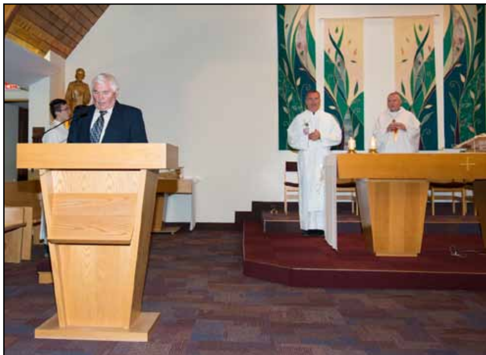
Z bohoslužeb ve Winnipegu

ABE: Jan XXIII. je spojován s druhým vatikánským koncilem, papež František je k němu často přirovnáván, co by měl takový třetí vatikánský koncil řešit?