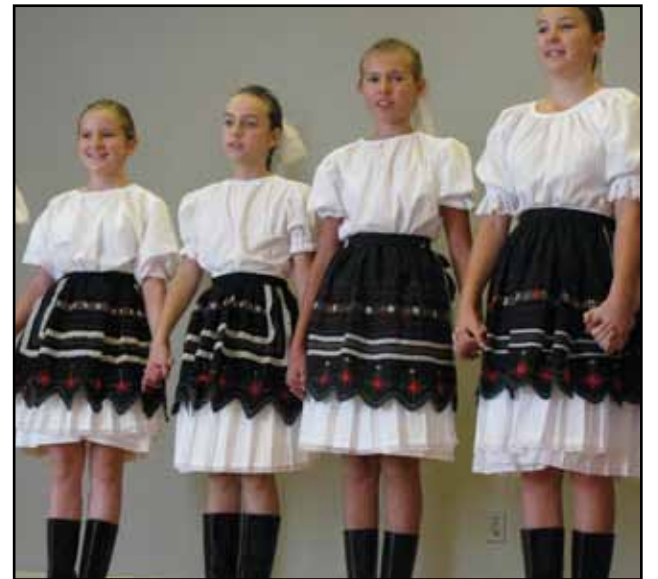
Po slavnostním obědě vystoupila skupina Východná Slovak Dancers

Církev je moudrá, když mluví o dědičném hříchu. Člověk se rodí z Boží ruky, ale má náklonost ke špatnému. Vždycky musíme bojovat s pokušením, ať jsme vlastníci nebo