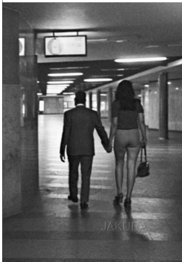
JAROSLAV KUČERA: PRAHA, PODCHOD NA VÁCLAVÁKU - MILENCI NA JEDNU NOC Tato fotografie byla použita i v mém filmu