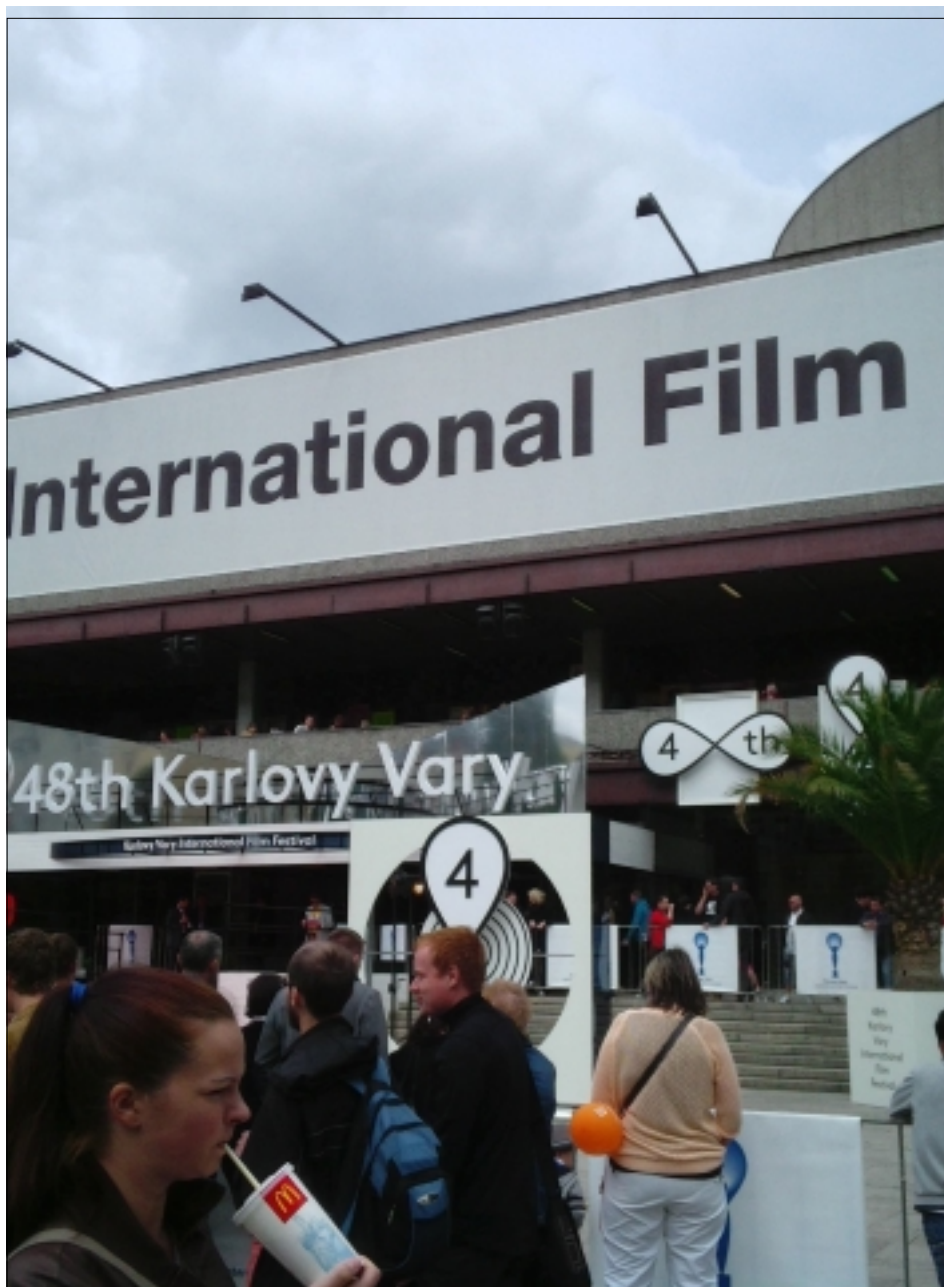
TAKHLE TO VYPADALO PŘED HOTELEM TERMAL V DOBĚ 48. MFF

Zázrak, kdy v jakési soukromé ZOO nebo malém cirkuse zmizí žirafa je