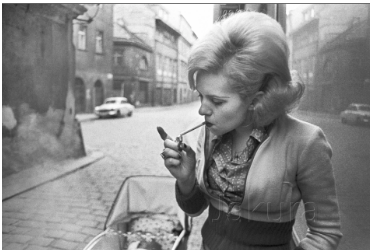
PRAHA, MICHALSKÁ ULICE -PŘED BLATNIČKOU, 1973

Rakovina jakoby zachvátila tuto zem, ale i celou východní Evropu, včetně Ruska. V roce 1974 byl Alexandr Solženicyn vyvezen násilím ze Sovětského svazu. Zastalo se ho pouze pár lidí. Jedním z nich byl básník Jevgenij Jevtušenko (shodou okolností dnes