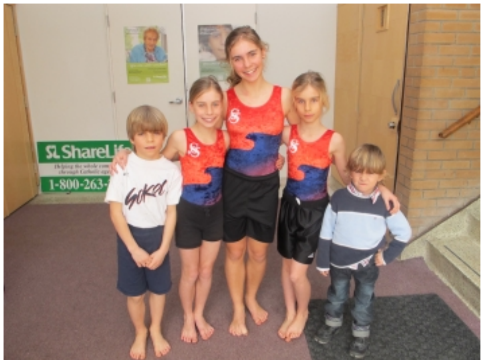
...A JEJICH DĚTI (POUZE NEJMLADŠÍ CHYBÍ)