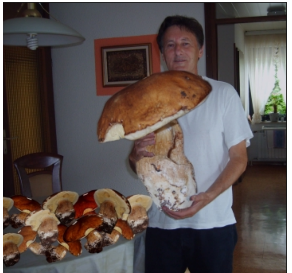
ROST'A FIRLA S NEBÝVALÝM ÚLOVKEM