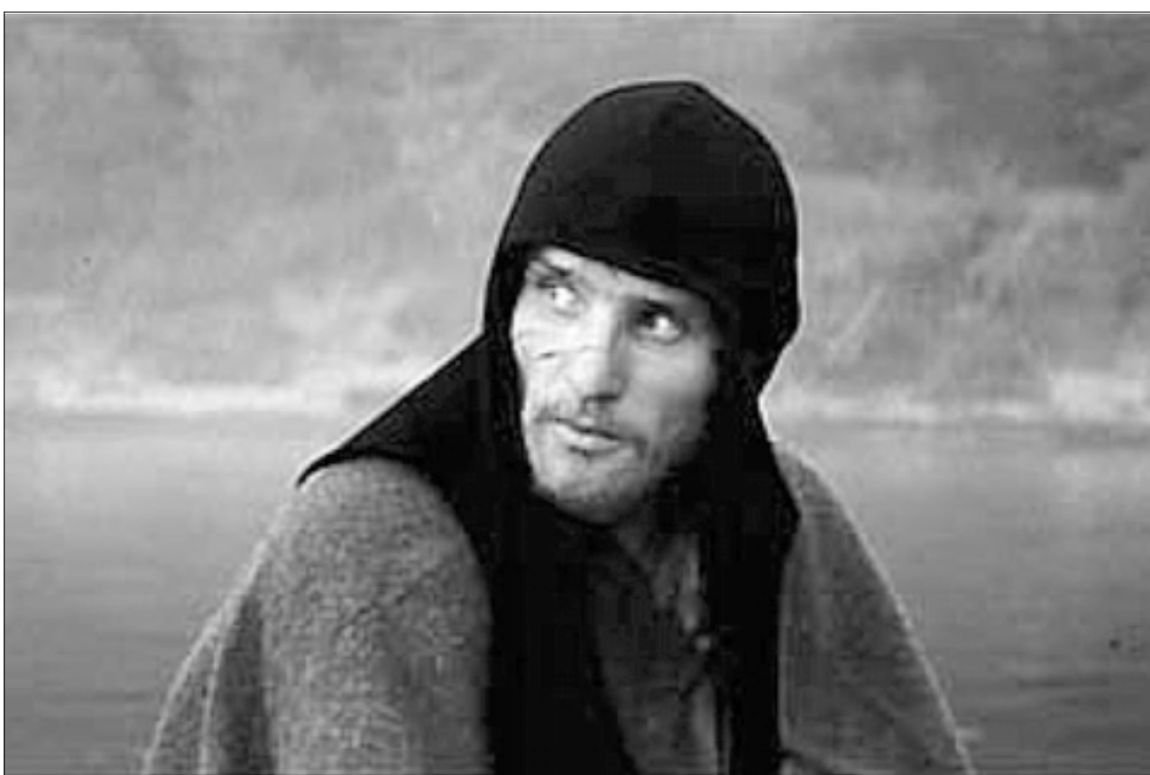
Z FILMU ANDREJ RUBLEV

Ze svého dětství se pamatují, jak v Krkonoších, v Herlíkovicích, vždy zvon svolával věřící v neděli ráno do evangelického kostela v horách. Byl to snad jediný hlasitý