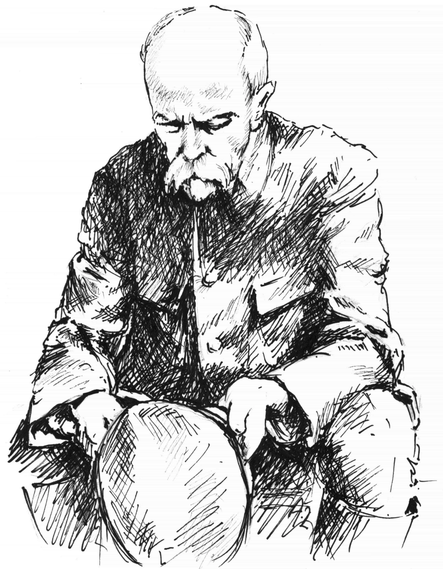
Tomáš Garrigue Masaryk